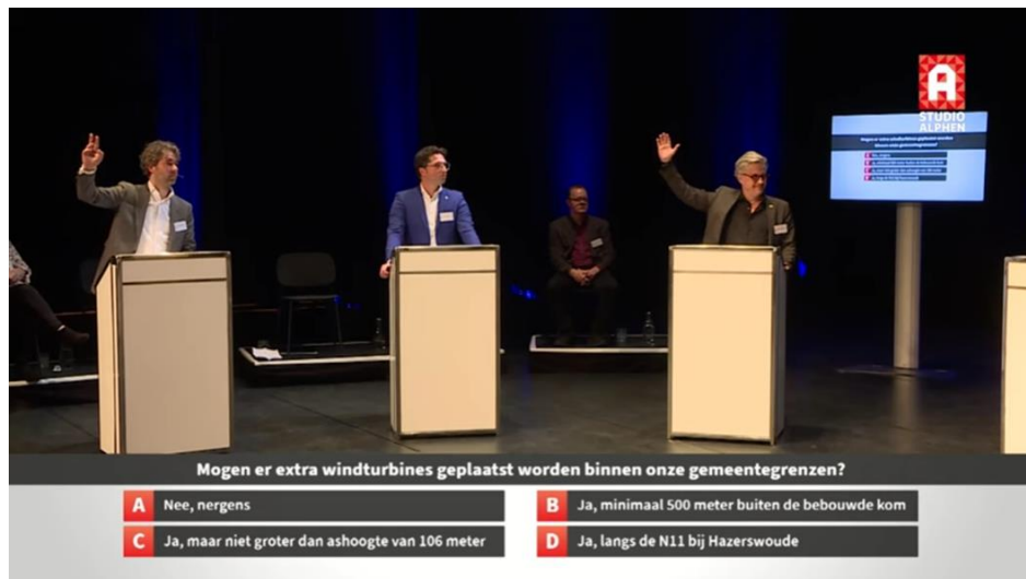
lijsttrekkersdebat 7 maart 2022

Verder in het jaar komt het land uit de harde lockdown, waarmee het 'oude' normaal weer terugkeert. Evenementen zoals het Zomerspektakel aan het Meer kunnen doorgaan en de Trekkertrek Familiedag in Koudekerk aan den Rijn wordt zoals vanouds uitgezonden door Studio Alphen. De sportcompetities draaien weer, waarmee deze vaste pijler ook weer een nadrukkelijke plek binnen de radio- en televisieprogrammering van Studio Alphen krijgt.