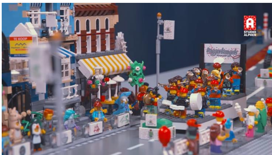
alternatief voor BoskooPs carnaval met een reportage van de optocht gemaakt van Lego

Het jaar 2022 begint in een harde lockdown vanwege het coronavirus. Studio Alphen brengt de gevolgen van de lockdown in beeld en laat zien hoe de samenleving omgaat met deze ingrijpende maatregelen. Evenementen kunnen opnieuw geen doorgang vinden en organisaties zoeken naar alternatieven om tradities zoveel mogelijk in stand te houden. Zo heeft Studio Alphen de VO Awards ook in 2022 uitgezonden op televisie, met een aangepast programma vanuit Theater Castellum. In het 'Gesprek met de burgemeester' namen we de ontwikkelingen van de coronamaatregelen regelmatig door met burgemeester Liesbeth Spies. Het feestelijke jubileumjaar van Boskoop wordt afgetrap met een speciale televisie-uitzending van Studio Alphen, die de aftrap van de festiviteiten vormt. Later vormt een speciale televisie-uitzending met een Lego-variant van de carnavalsoptocht in Boskoop het middelpunt van de festiviteiten in Kwakveen.