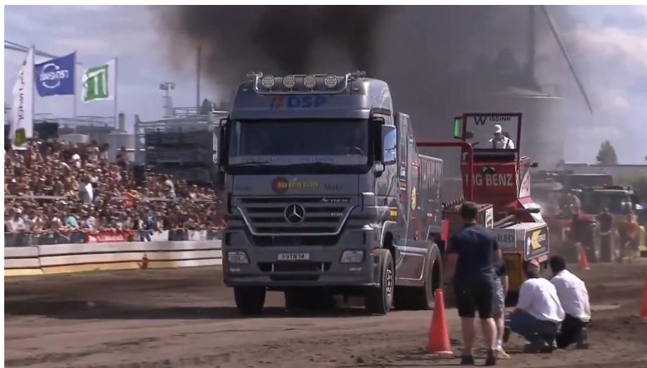
Trekkertrek Familiedag Koudekerk aan den Rijn

Verder in het jaar komt het land uit de harde lockdown, waarmee het 'oude' normaal weer terugkeert. Evenementen zoals het Zomerspektakel aan het Meer kunnen doorgaan en de Trekkertrek Familiedag in Koudekerk aan den Rijn wordt zoals vanouds uitgezonden door Studio Alphen. De sportcompetities draaien weer, waarmee deze vaste pijler ook weer een nadrukkelijke plek binnen de radio- en televisieprogrammering van Studio Alphen krijgt.